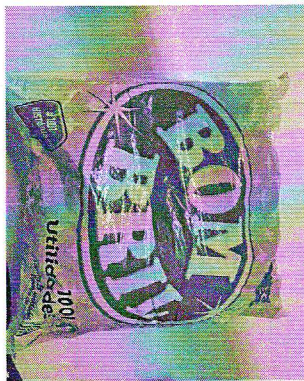
item 14 - Sabão em barra